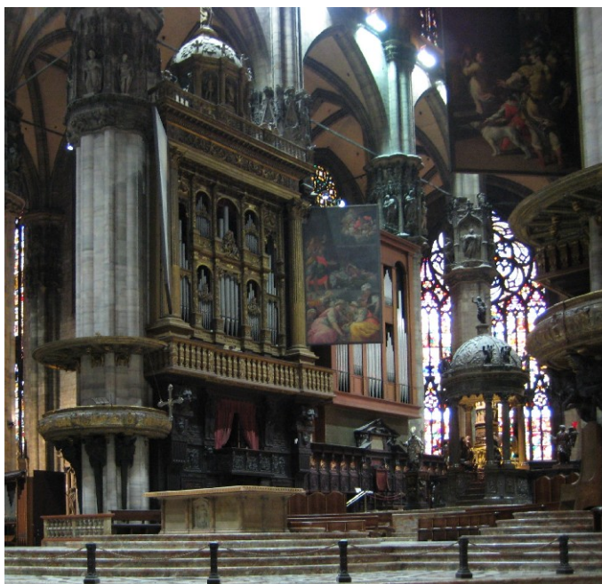
Fig. 13: Mailand, Dom, Orgel der Nordseite des Chores. Prospekt von Gian Giacomo Antegnati 1552-59.

Zur Unterscheidung der weitmensurierten Flötenstimmen von den enger mensurierten Principalstimmen wurden die Flötenstimmen hier in einer eigenen Spalte aufgeführt. Sie werden nicht zum Principalplenum, dem »Ripieno« gezogen, sondern dienen dazu, um zusammen mit dem Principale eine besondere, synthetische Klangfarbe zu erzeugen. Auch das Register Fiffaro (auch Voce umana genannt) wird nicht zum Principalplenum gezogen. Es handelt sich um ein zweites, schwebend eingestimmtes Principal im Diskant, das gemeinsam mit dem Principale gebraucht wird; dieser schwebende Klang wurde zum Ausdruck von Trauer eingesetzt. Flötenregister und Fiffaro sind historisch gesehen Fortentwicklungen der zweiten, etwas weitmensurierten Principal- und Oktavreihe im mittelalterlichen Blockwerk. Die übrigen Register der linken Spalte vom Principale bis zur Vigesima Seconda 1' entstanden historisch durch Aufteilung des Blockwerks in Einzelreihen. Diese Reihen zusammen bilden das Principalplenum, den Nachfahren des Blockwerkklangs. Die Reihen oberhalb der Vigesima seconda 1' wurden im 16. Jahrhundert noch hinzugefügt, um den Plenumsklang strahlender zu machen. Alle diese Reihen sind benannt nach dem Intervall, das sie zusammen mit dem Principale erzeugen. Solche Intervallbezeichnungen als Registernamen sind charakteristisch für den Reihenstil.